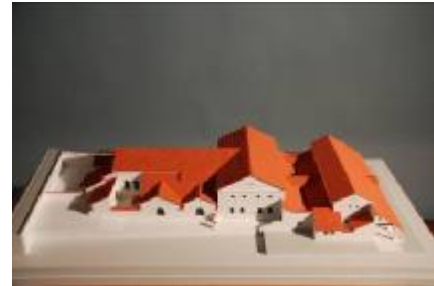
Modell der Therme von Carnuntum

Zahlreiche Highlights, wie die originalgetreue Rekonstruktion einer römischen Therme, ein 12 Meter langes dreidimensionales Modell von Carnuntum und in akribischer Kleinarbeit restaurierte antike Fundstücke versprechen ein besonderes Ausstellungserlebnis.